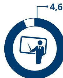
Valutazione docenti Scala valore da 1 a 5